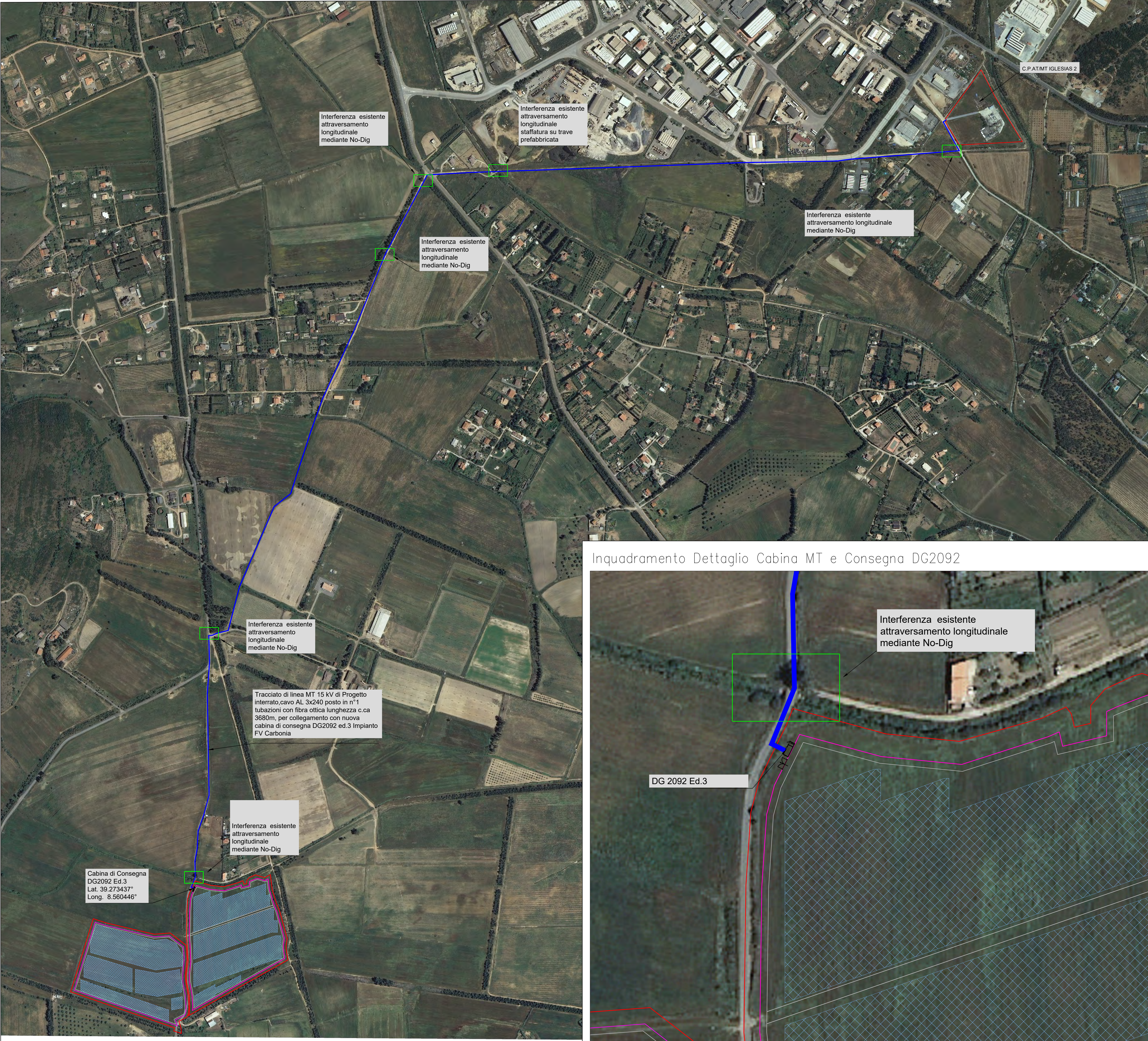
Inquadramento Dettaglio Cabina MT e Consegna DG2092