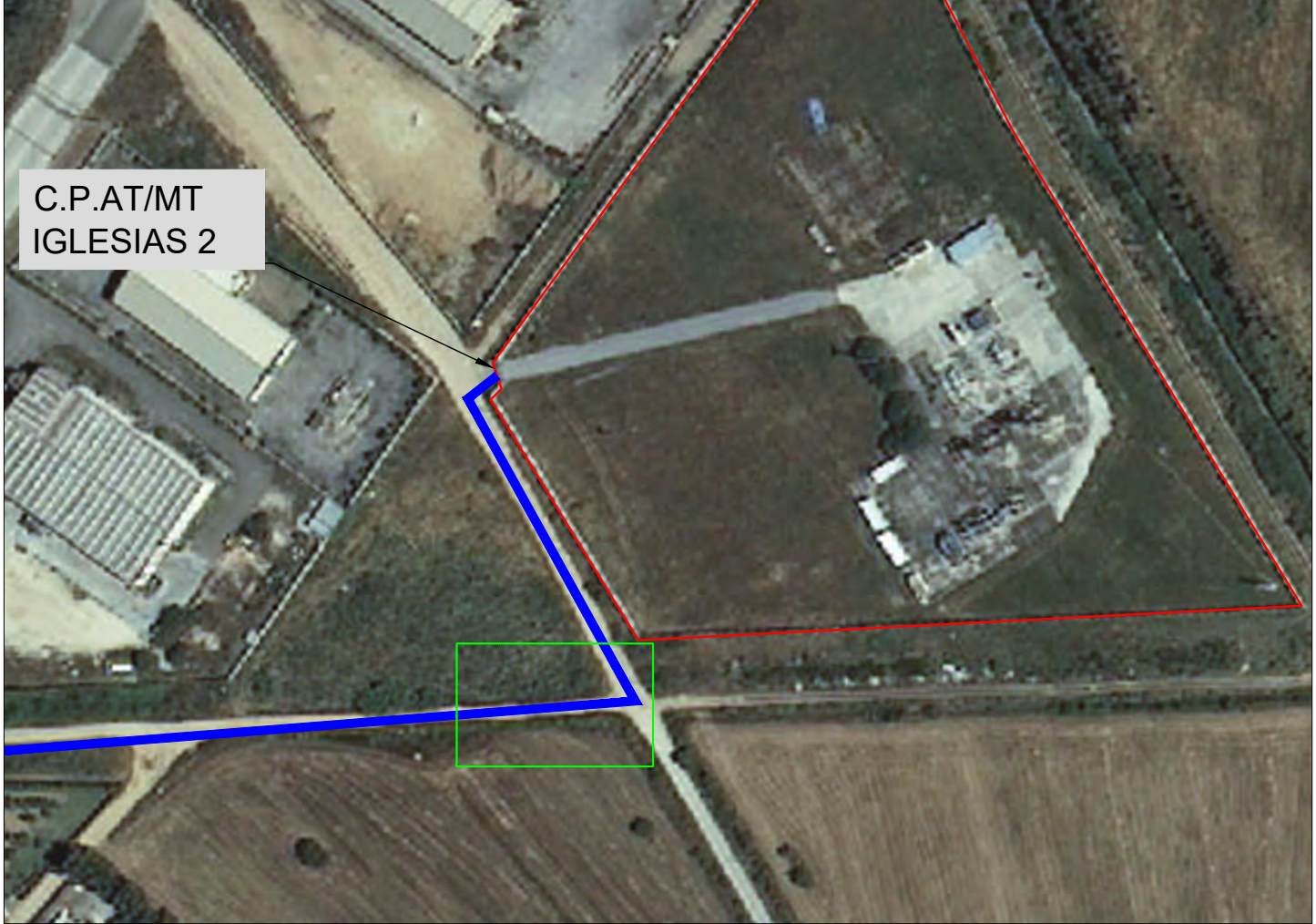
Inquadramento Dettaglio C.P. Foiano

IMPIANTO DI RETE PER LA CONNESSIONE 15 KV IMPIANTO FOTOVOLTAICO "CARBONIA-IGLESIAS" COMUNE DI CARBINA (CA) LOCALITA' "ACQUAS DERETTAS"